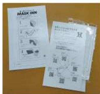
使い捨てマスクケースの配布