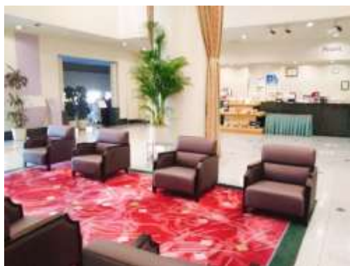
2階ロビー（ソファの間隔を広くしました）