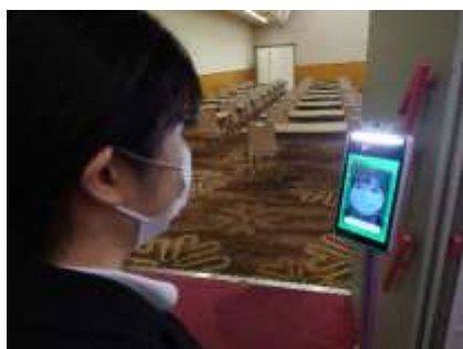
サーマルカメラ設置（2 階鳳凰）