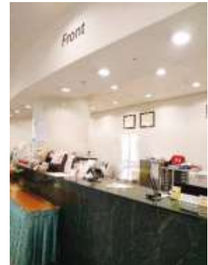
2階フロント（アクリルパーティション設置）