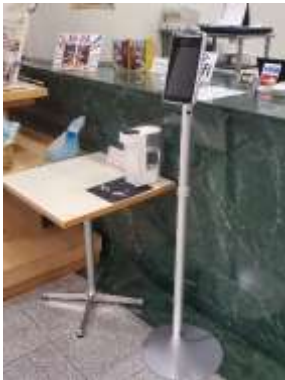
2階フロント（非接触型検温消毒機設置）