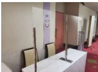
会場受付 2 階（飛沫感染防止シート）