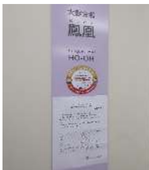
ゴールドステッカー