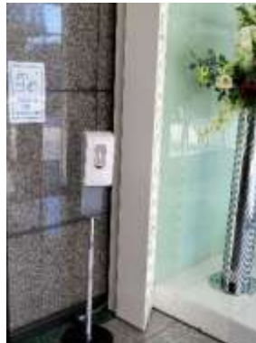
2階正面玄関自動扉